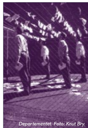
Departementet.