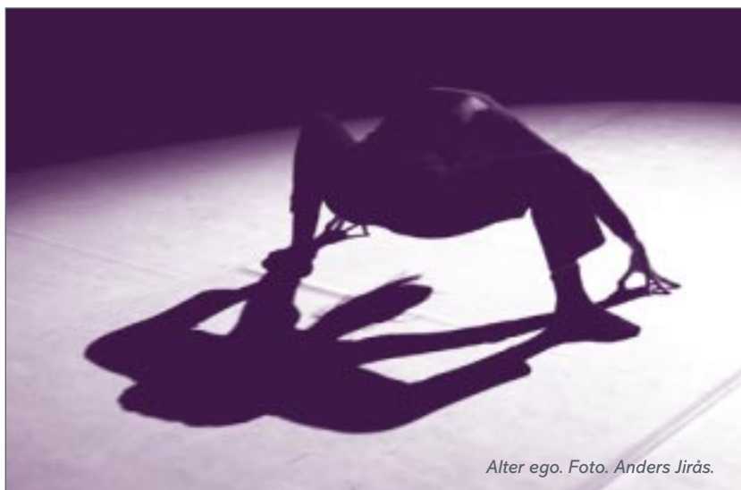
Alter ego.

Den 18 september är det premiär för Manifesto . Tre olika men starkt tongivande koreografer står bakom de tre verken i Manifesto . Artifact II av William Forsythe,