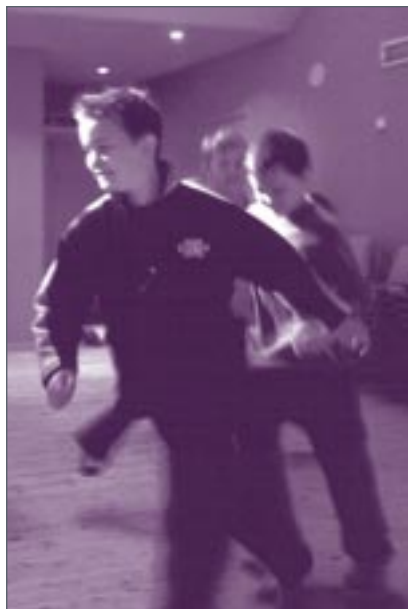
Danslägerskola på Vitlycke Museum.

En årskurs 3 – 4 från Orust kom till Vitlycke och fick börja dagen med en