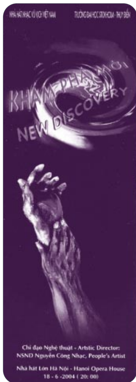
Programblad – Ballet Contemporary Dance Vietnam & Sweden.

VI VAR PÅ SEMESTER i det vänliga landet Vietnam och i dess huvudstad Hanoi. Det är en stad med 7–8 miljoner invånare, en gammal fransk stadskärna med smala gator kantade av träd och blommande bougainvillea.