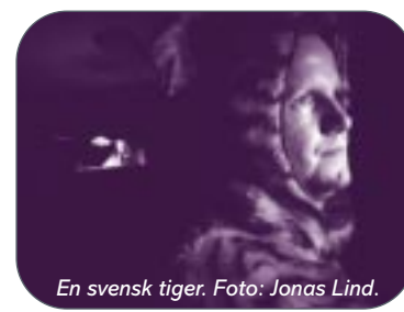
En svensk tiger .