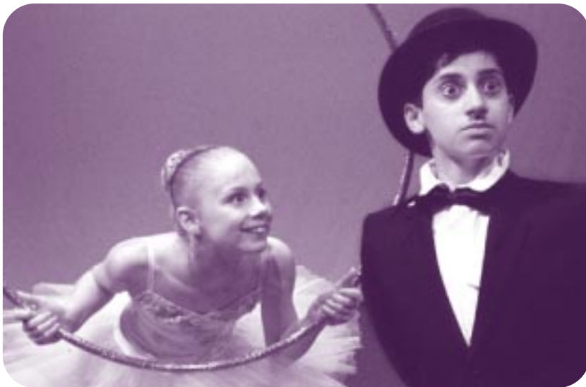
Svenska Balettskolan – 10 år.