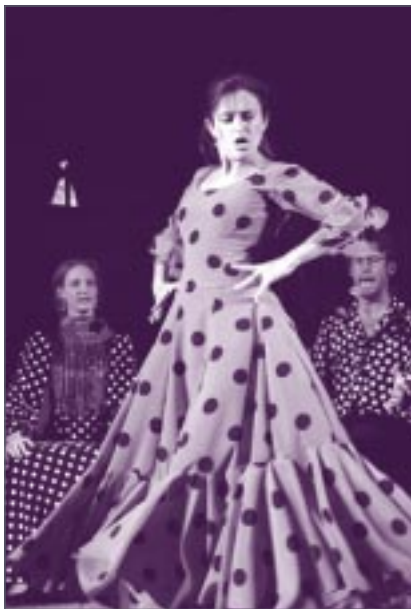
Flamenco En Marcha.

Krokstrandsfestivalen »Man Must Dance« hölls för sjätte året i rad den 29 – 31 juli 2004. 3 000 personer dansade i tre dagar, och av dem gick ca 450 personer på kurser och workshops i bl a tango, flamenco, afrikansk dans och rytmik/slagverk för kroppen. Som vanligt stod världsmusiken och världsdansen i fokus och på kvällarna pulserade Stora Tältet av rytmer från fem världsdelar.